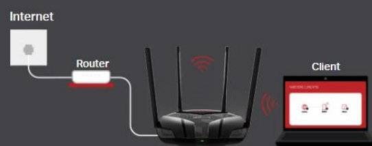
Access Point Mode

Creates a wireless network for all your WiFi devices